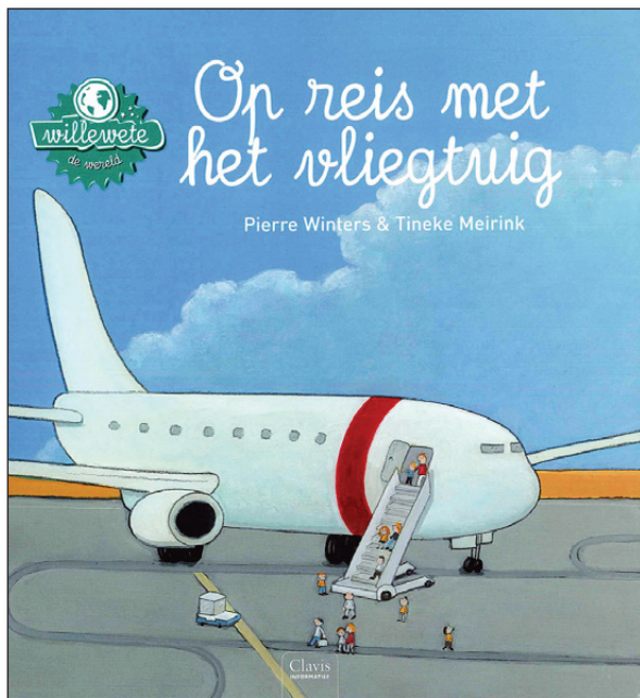
© 2010 Clavis uitgeverij, Op reis met het vliegtuig. Tekst Pierre Winters, illustraties Tineke Meirink.

Wille wete: de wereld Op reis met het vliegtuig Pierre Winters & Tineke Meirink, uitgeverij Clavis ISBN: 9789044813029