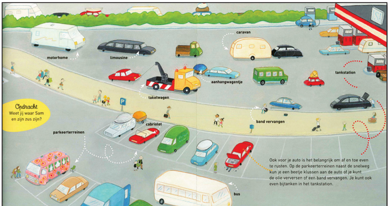
© 2011 Clavis uitgeverij, Op reis met de auto. Tekst Pierre Winters, illustraties Tineke Meirink.