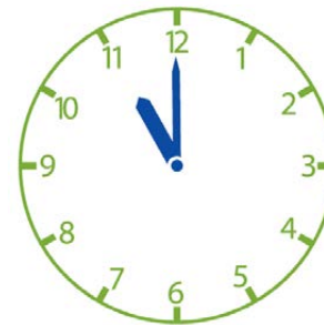
Om 11 uur rijdt Janneke op de tractor.