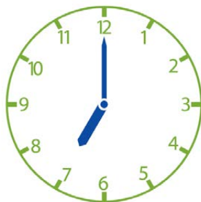
Om 7 uur gaat Janneke de koeien melken.