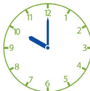
Om 10 uur voert Janneke de kippen.