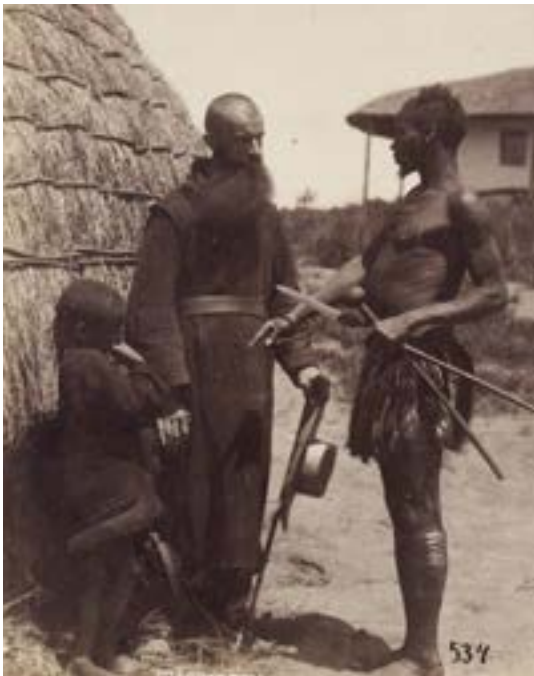
Bron 2 Een foto, gemaakt door de missionarissen rond 1895. De missionarissen schreven er als bijschrift bij: 'Kaffer stelt zijn kind onder de hoede van een missionaris.' Het woord 'kaffer' werd vaak gebruikt als term voor bewoners van Afrika. Inmiddels zien mensen het als een scheldwoord: het is een naam die Europeanen aan Afrikanen gaven in een tijd dat ze hen minderwaardig vonden.