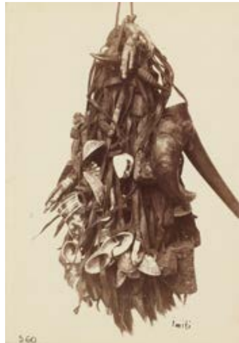
Bron 3 Een foto, gemaakt door de missionarissen rond 1895. De missionarissen legden in het bijschrift uit dat deze tas vol zat met 'tovermedicijnen' van traditionele genezers. Ze schreven: 'De Kaffers hebben daar veel voorbeelden van, en zij geloven daar heel vast in.'