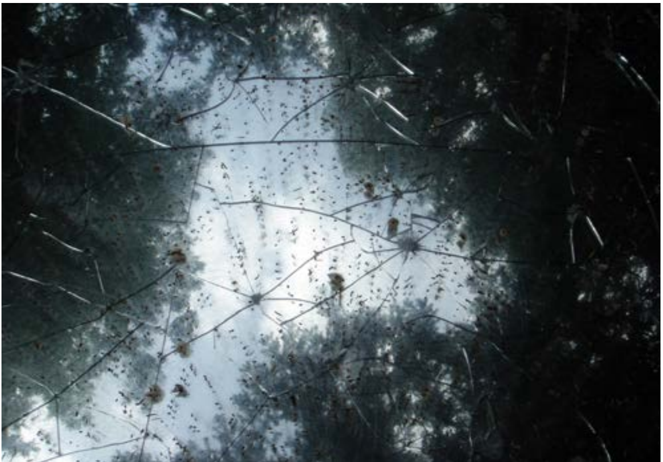
Bron 1 Een blik op het monument Nooit meer Auschwitz van schrijver en kunstenaar Jan Wolkers. Nieuwe Oosterbegraafplaats, Amsterdam.

In deze opdracht denk je na over de vraag hoe gebeurtenissen uit het verleden later officieel herinnerd worden.