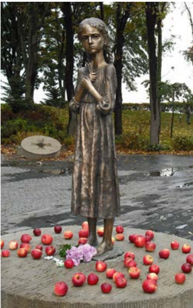
Bron 4 Monument in de Oekraïense hoofdstad Kiev ter herdenking van de gebeurtenissen in Oekraïne in 1932-1933.

Al deze tragedies hadden een jaar geleden plaatsgevonden. Nu lag ze dood voor ons op een zanderige weg. Ook zij had geprobeerd de rivier te bereiken of het bos, als een laatste plaats om iets te eten te vinden. Maar het mocht niet zo zijn. De sporen in het zand gaven aan dat ze had geprobeerd te kruipen. Ze lag met haar gezicht naar beneden, met gezwollen handen uitgestrekt, haar tanden diep in het zand alsof ze had geprobeerd het te eten. Het was een triest gezicht, maar we hadden al zoveel van dit soort gevallen gezien, dat we slechts een moment in stilte naar haar keken en toen verdergingen. We konden nu niets meer voor haar doen.