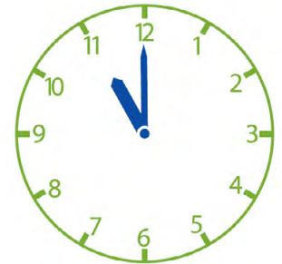
Om 11 uur rijdt Janneke op de tractor.