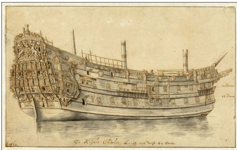
Schip de Royal Charles, Abraham Storck, 1672. Rijksmuseum, Amsterdam

3 Waarom was Michiel de Ruyter zo populair, denk je?