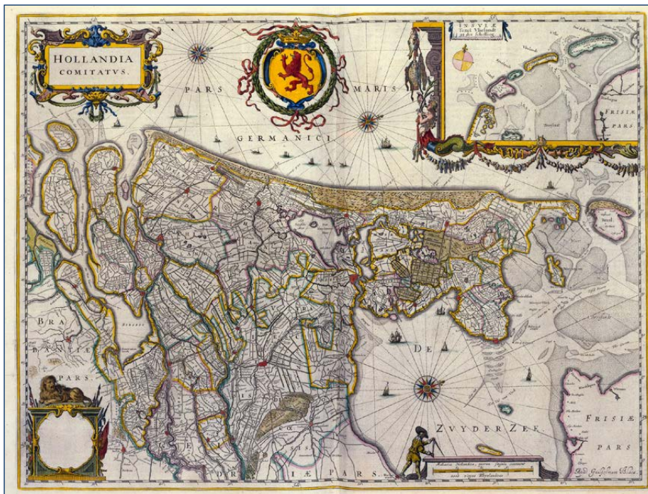
Joan Blaeu, Atlas Major, Amsterdam 1664. Koninklijke Bibliotheek Den Haag

Veel kaarten waren nog door zijn vader gemaakt, en verouderd. Maar dat was niet zo erg, want deze atlas was niet voor avontuurlijke zeelui. Omdat hij zo mooi en duur was, legden rijke kooplieden hem op de salontafel.