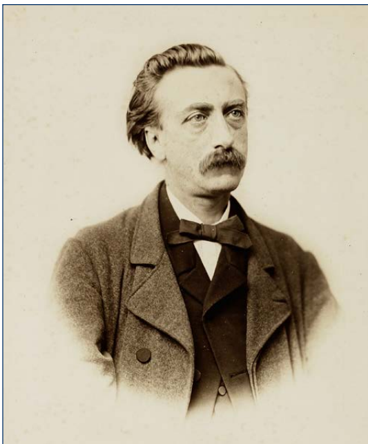
Multatuli, 1864.

Het boek was erg duur en dus alleen voor rijke mensen, maar toch werd het heel snel heel bekend. En zo kwamen steeds meer mensen te weten hoe het echt was in Indië. Zo zou uiteindelijk de situatie van de boeren in Nederlands-Indië langzaam verbeteren.