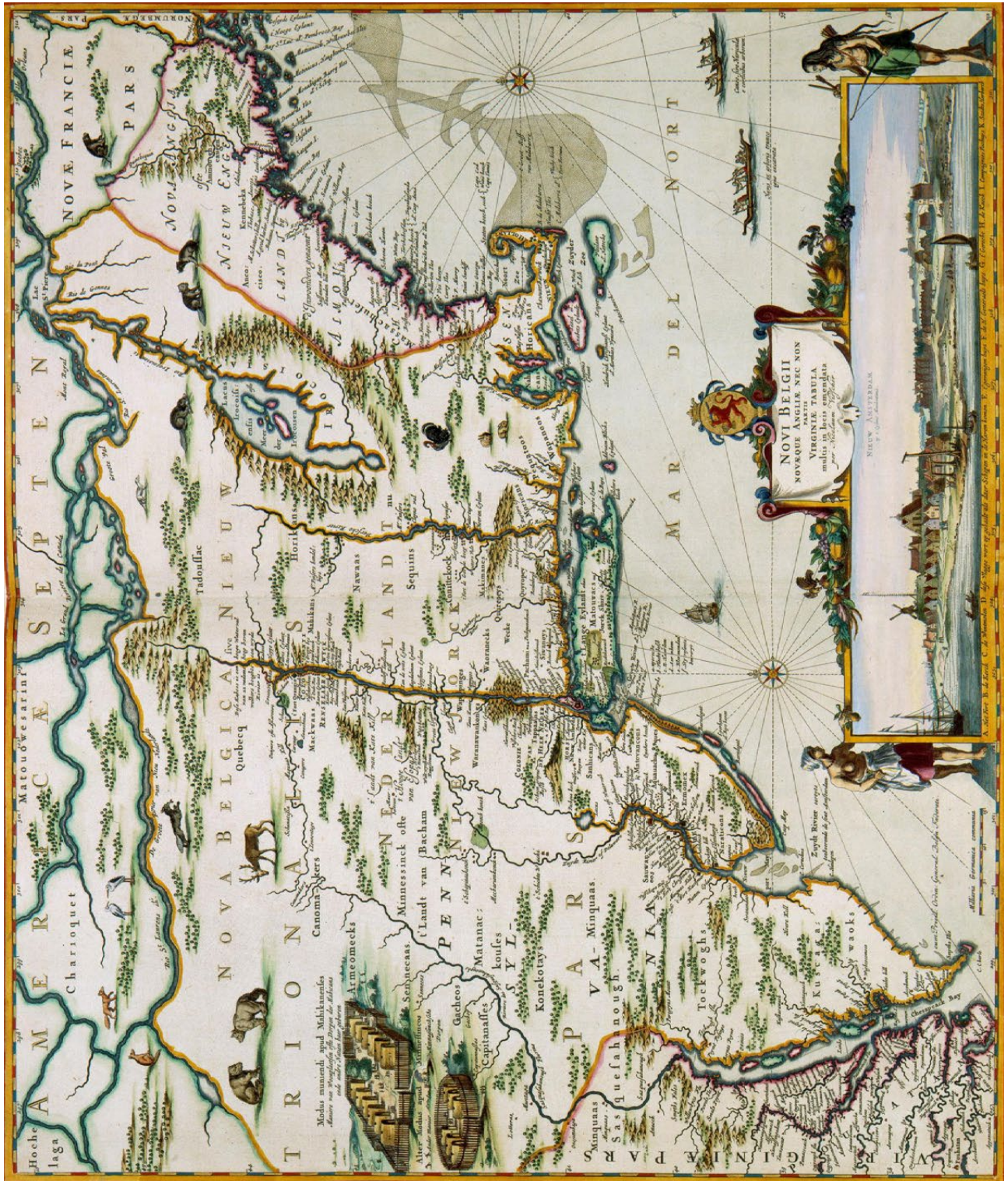
Bron: Nicolaas Visscher II, Kaart van Nieuw Nederland, 1684. Koninklijke Bibliotheek, Den Haag